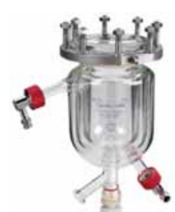
Type 1BI Glass pressure vessel with heating jacket, drain valve and vacuum insulation jacket 0.5 / 1.0 l