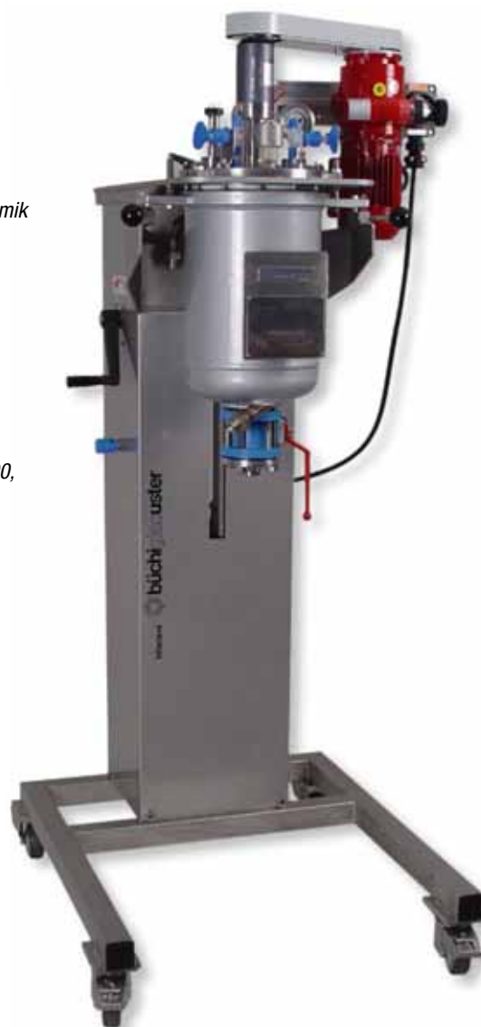
Drehbarer Reaktor zur einfachen Reinigung und Wartung des Reaktors