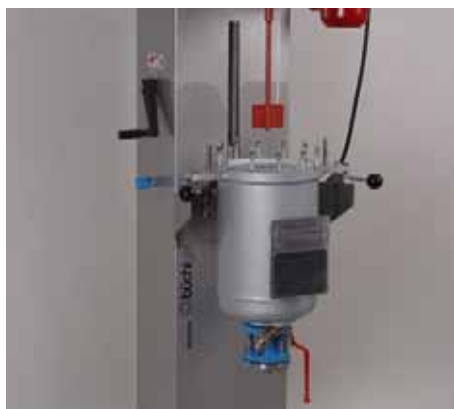
Tilttable reactor for easy cleaning and maintenance