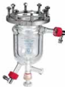
Type 1B Glass pressure vessel with heating jacket and drain valve 0.5 / 1.0 l