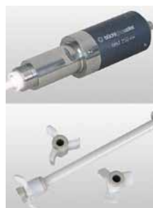
Powerful, completely inert magnetic coupling bmd 250i