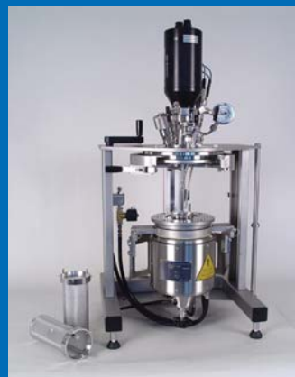
midiclave with cyclone 300 midiclave mit cyclone 300