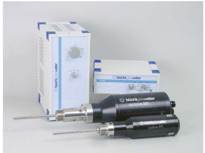
cyclone 075 and cyclone 300 magnetic stirrer drives for full vacuum to high pressure reactors cyclone 075 und cyclone 300 Magnetantriebe für Vakuum- und Druckreaktoren

Das Steuergerät des cyclone 300 ermöglicht die stufenlose Drehzahlregulierung des Servomotors. Über eine serielle RS 232 Schnittstelle können Drehzahl und Drehmoment an das bds Mess- / Anzeigergerät und / oder an die bls-Software übertragen werden. Externe Drehzahl Sollwertvorgabe ist über ein 4...20 mA Signal möglich.