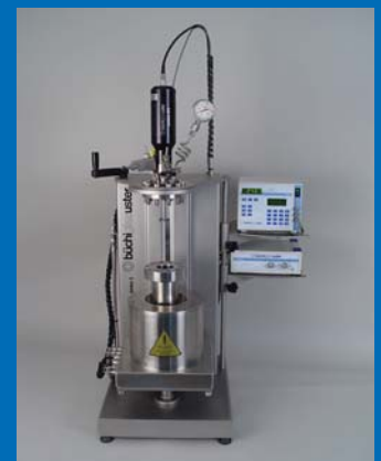
limbo li 350 bar high pressure reactor with cyclone 075 limbo li 350 bar Hochdruck- Reaktor mit cyclone 075