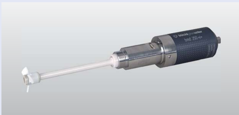
fully metal - free magnetic coupling bmd 250 «i» Komplett metallfreie Magnetkupplung bmd 250 «i»