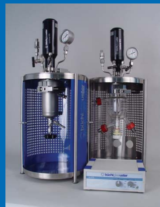
Compact cyclone 075 stirrer drive for picoclave Lab pressure reactor Kompakter cyclone 075 Rührantrieb für Labor-Druckreaktor picoclave