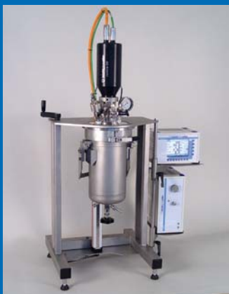
cyclone 300 on versoclave cyclone 300 auf versoclave