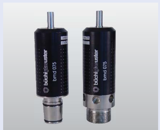
Threaded connections for metal cover plates or NS 29/32 connections for glass reactors Gewinde Verbindung für Metall Reaktoren oder NS 29/32 Anschluss für Glasreaktoren