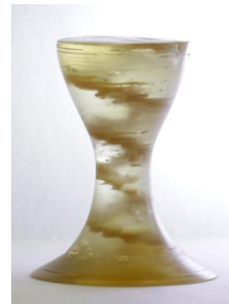
Abb. 2: Wendeltreppe aus Kunststoffharz und Füllstoff 1