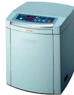
Abb. 1: THINKY ARE-250

Abb. 3: Ein Objekt mit lokal verschiedenen Materialzusammensetzungen nimmt beim Anschwellen in einem Lösungsmittel eine vorprogrammierte Form an. Eine mögliche Anwendung davon ist als fixierendes Verbindungsstück in der Medizinaltechnik.