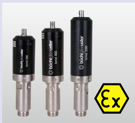
Magnetic coupling with higher torque Magnetkupplung mit grösserem Drehmoment