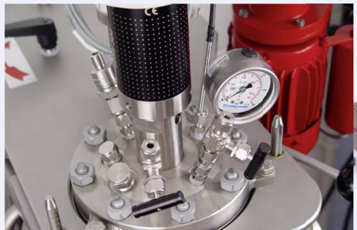
Cover plate with 7 openings Deckelplatte mit 7 Öffnungen