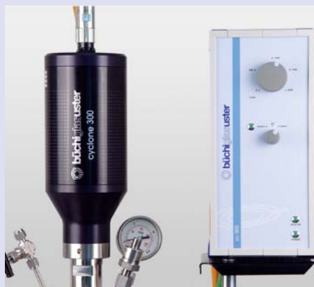
Agitator with cyclone 300 Rührwerksantrieb mit cyclone 300