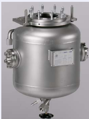
Type 4 Metal vessel with heating jacket, 2 sight glasses and drain valve