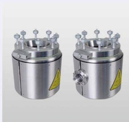
Vessels with electric heating/water cooling Gefässe mit Elektro-Heizung/Wasserkühlung