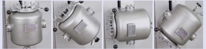
Pivoting function for easy vessel cleaning

Gefäße mit verschiedenen Volumen lassen sich einfach austauschen.