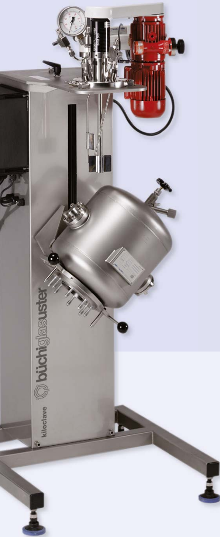
Pivoting function for easy vessel cleaning