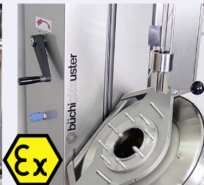
kiloclave with manually operated hydraulic lift kiloclave Lift mit hydraulischem Handantrieb