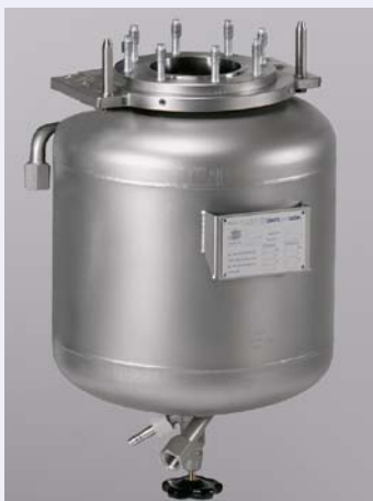
Type 3 Metal vessel with heating jacket and drain valve