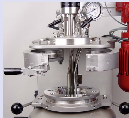
Fast action closure for vessels Schnellverschluss für Gefässe