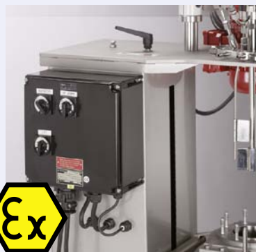
kiloclave with electrically driven lift kiloclave mit elektrischem Lift